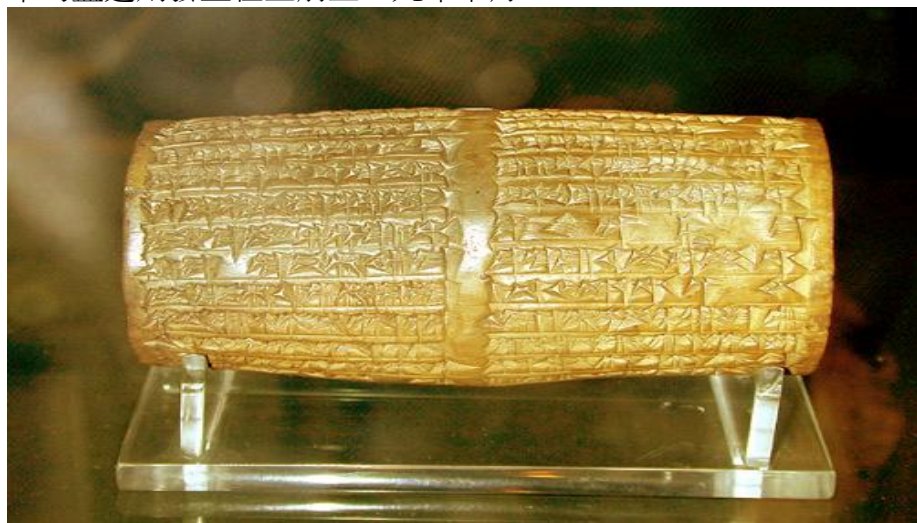
拿波尼度的圓筒石碑上刻有伯沙撒之名

五1 伯沙撒 伯沙撒是巴比倫末代君王拿波尼度的兒子，與他共同執政。拿波尼度在特瑪居留了十年時，作兒子的他在巴比倫執行所有的君王職務。現今出土的許多文件上都有他的名字。從上一章至此已經渡過了約莫三十年。尼布甲尼撒於主前五六二年駕崩，本章的盛筵則發生在主前五三九年十月。