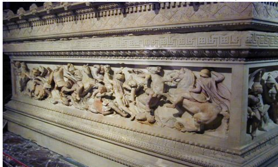
亞歷山大大帝的石棺上刻有戰事圖

在一連串戰爭之後，安提柯於主前三一一年向托勒密、卡桑德爾、利西馬科斯求和。西流古被孤立，但仍控制巴比倫。主前三〇九年托勒密決定向安提柯用兵，但卻後援不繼，以致在主前三〇六年被安提柯和兒子底米丟（Demetrius）反擊。但安提柯進攻埃及失敗。主前三〇五年托勒密和卡桑德爾、西流古、利西馬科斯（四角最有可能是指這四人）一同宣告為繼承亞歷山大的王國。但安提柯要到四年之後，才在主前三〇一年的伊普薩斯（Ipsus）一役中陣亡。卡桑德爾三年後身亡（主前298年），底米丟亦繼續製造騷亂，但帝國四分，卻是這個長達二十年的繼承鬥爭的結局。