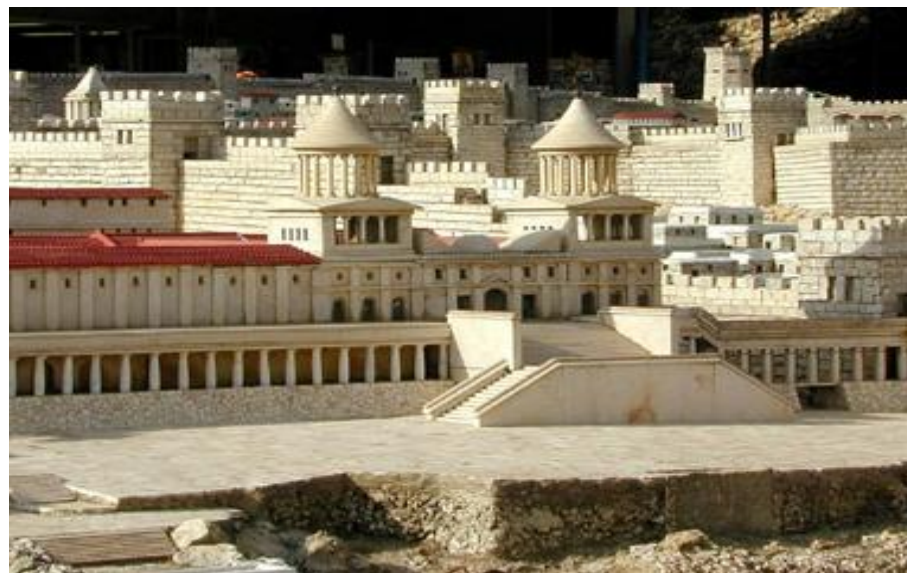
哈斯摩寧宮殿模型

主前一六六年安提阿古派遣特使到他們的城鎮實施新規條時，瑪他提亞與五名兒子約翰、西門、猶大、以利亞撒、約拿單以武裝回應，把他殺死。全家繼而離城出走，開始革命。在軍事領袖猶大的率領下，他們開始攻占小鎮，意圖切斷前往耶路撒冷的一切通道。這個封鎖行動十分有效，他們終於奪回耶路撒冷，並於主前一六四年十二月，聖殿被污穢恰好三年之後，重新淨化聖殿。然而但以理書十一章並沒有記載這一件事，並且本段對馬喀比革命是褒是貶，學者仍爭議不休。