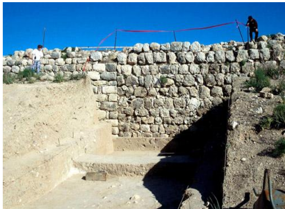
拉吉的戰壕顯示圍牆的改變

三十四7 拉吉和亞西加 這兩個猶大城堡把守薩非拉的疆界，是惟一未被巴比倫侵略軍攻取的兩個城鎮。拉吉支配了薩非拉和猶大西部全區，是猶大諸王防線的中點。這城介乎耶路撒冷和非利士城邦的中間，把守著沿海地區進入內陸的主要通道。遺址杜韋爾遺址發現了一些銅石器時代有人定居的痕跡。這地在中銅器時代第二期（作為迦南重鎮）和鐵器時代第二期（王國分裂後被建立為西疆要塞；代下十一5~10）有大規模的城防設施，其城門十分壯觀。拉吉雖然居高臨下（其遺址高達一百五十呎），主前七〇一年亞述王西拿基立圍城之後依然把它攻取（參看：西拿基立的年表，進一步資料，見：代下三十二9的註釋）。尼尼微王宮中的亞述浮雕，以及遺址西南角之巨型坡道遺跡，都是戰況慘烈的生動證據。內中有一千五百具骸骨的千人塚，可能也是城陷的結果。這城在主前七世紀末重建，但從此不能恢復亞述時代的重要性。