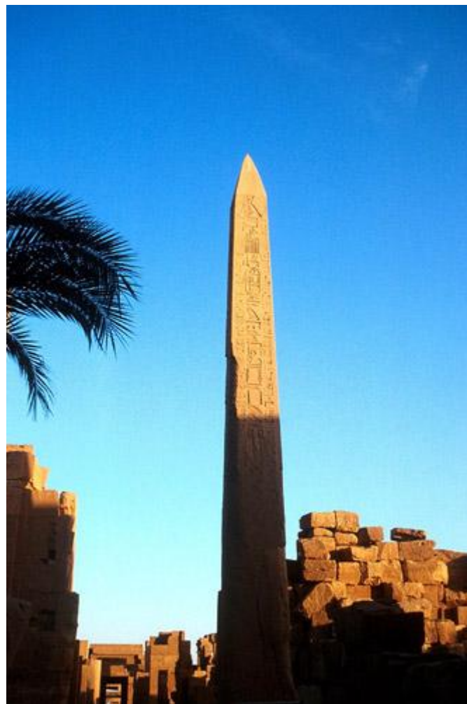
卡納克神廟的花崗岩稜柱

四十三13 柱像 本節所用的希伯來字眼是指柱子或直立的石頭，作為事件的紀念、盟約的訂立、神殿的入口，或神祇的偶像（見：創二十八18~22；出二十四4；王上十四23）。在埃及的背景中，獨立的紀念石柱通常稱為稜柱（obelisk，或稱方尖石碑），豎立原因通常是重要戰功或奉獻廟宇。例如：希流坡利斯通往亞孟一銳廟的遊行大道，兩旁就各排列了一行稜柱。