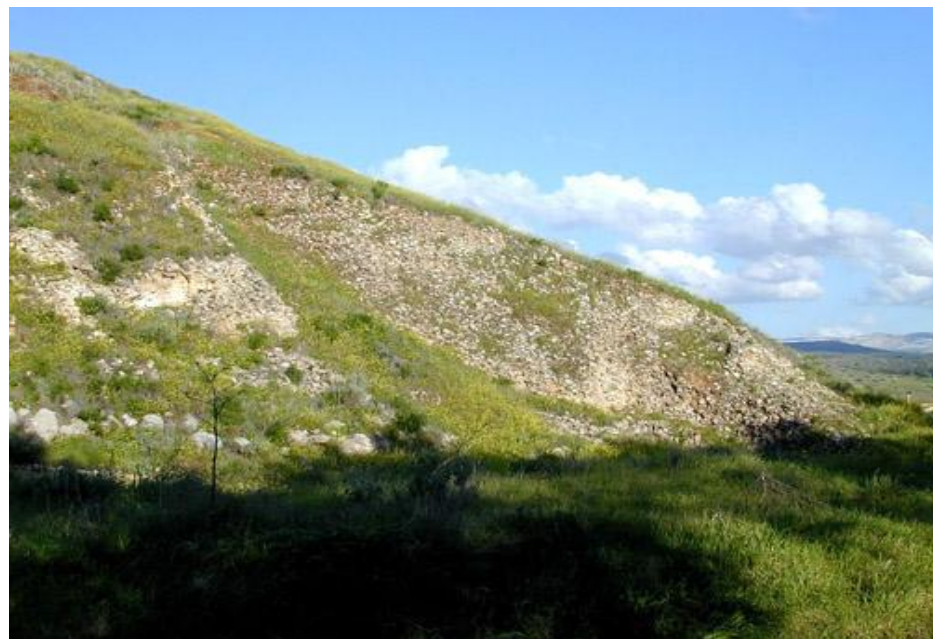
拉吉的攻城土坡橫切面

六6 築壘攻城 古代的攻城戰術是出了名的無用。築壘攻城是有用的辦法，但十分危險，守城的人能用盡方法來阻撓其進度。「壘」其實是攻城坡道，通常是用樹木和石塊為基礎，加上泥土或手頭所有的其他雜物堆成。亞述無數的壁畫浮雕描繪它在近東各處的應用。再者，猶大的拉吉更挖掘到一條亞述攻城坡道的遺跡（進一步資料，可參看三十二章24節的註釋）。亞述成功地攻取了這個堡城，把它摧毀。