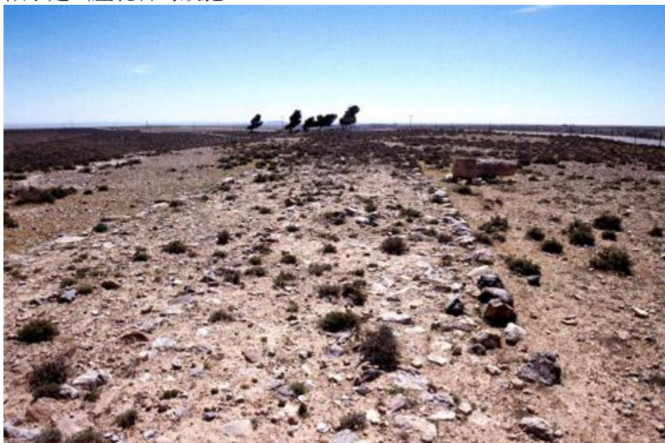
王道上羅馬道路的殘跡

點。他們在死海西岸隱基底的戈倫遺址（Tel Goren），發現了一個似乎是出產乳香的設施。