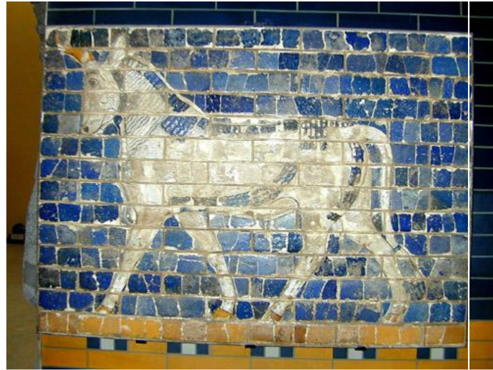
巴比倫伊斯他爾門上裝飾的馬

伊施他爾門已經出土修復，現存於柏林博物館（Berlin Museum）。這門有獅子和龍的裝飾，古城的宏偉可以想見。城牆和城門都是以石塊和泥磚建成。但城門有些門室必須使用木材作為梁木和鷹架，以便調配士兵。石頭若被火燒，就會碎裂崩潰（見：士九42~49）。