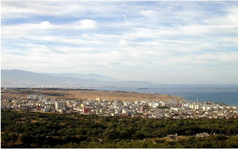
從黎凡特北端向南望

二11 古代近東國家更換神祇的先例 很多國家因為外來的影響，在其諸神系統中增添新神。但隨著時間的變遷，這些神祇的名字會稍有更改。但一國換了他的神在古代近東而言，是完全陌生的概念。這動詞大概有「以貨易貨」的意思。若然，其意思就不獨是更換，而是換取更有價值的事物。