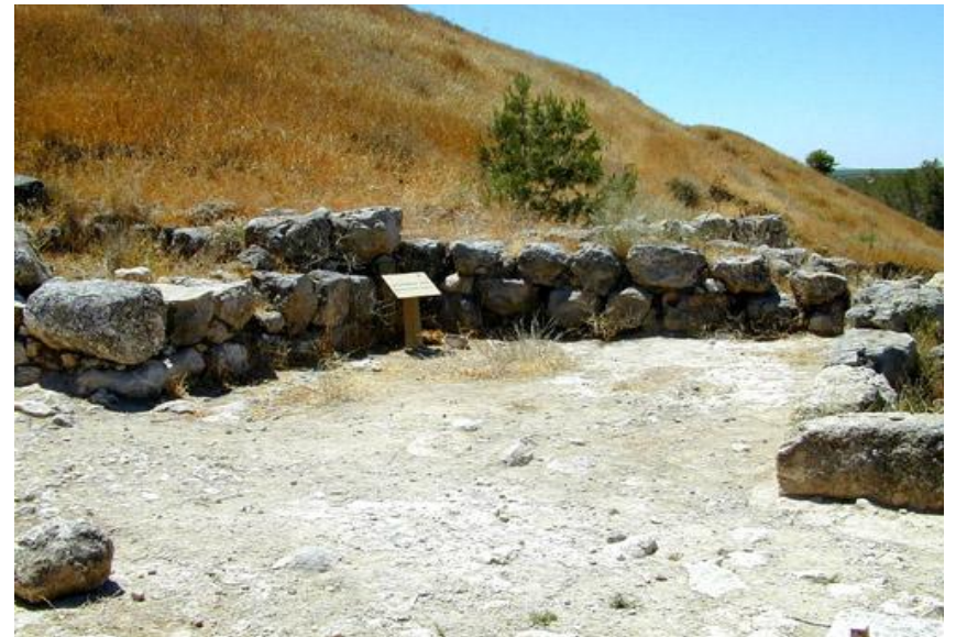
發現拉吉書函的城門口衛兵室