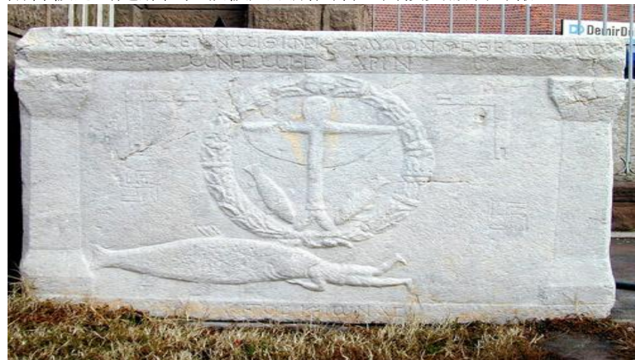
大魚吞下人的雕刻

二9 約拿許願 這篇禱文並未說明約拿所許之願為何，但大多數古代世界的誓願都與舉行儀式有關。利未記在敘述各種獻祭中，說明還願祭（見：利三1~5，二十七2~13註釋）。這個誓願的性質沒有進一步說明，有可能約拿會以某種感恩祭還他所許的願。沒有跡象顯示他許願要順從，甘心樂意的去尼尼微。在一首沙馬士的詩歌中，這個太陽神被認為是那位拯救被大浪所困者，而接受獻酒為報。