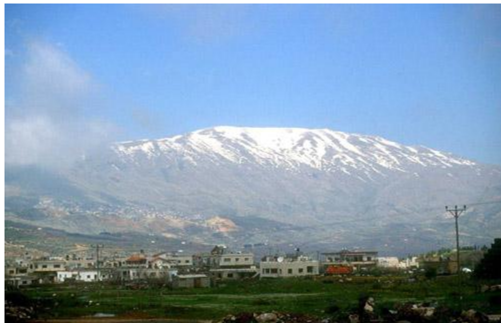
被雪掩蓋的黑門山

八十九12 他泊和黑門\cs8 這是以色列境內最顯著的兩座山。黑門山（前利巴嫩山脈中的一峰，海拔9,232呎）位於以色列的北界，經常積雪。他泊山則位於耶斯列谷的東北端，雖然只有1,929呎，遠不及黑門山，卻是從平原崛起，峨然獨立的孤峰。「他泊和黑門」若與本節上半之「南北」對偶，作者必然身在加利利地區。